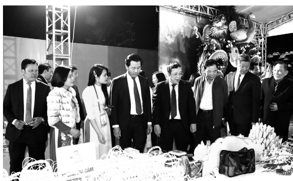
Các đồng chí lãnh đạo Trung ương và thành phố Hà Nội tham quan gian hàng trưng bày các sản phẩm nông sản, OCOP tiêu biểu tại Lễ hội nông sản TP. Hà Nội năm 2023.