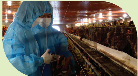
Tiêm phòng vắc-xin cho đàn gà.

Bằng cách thực hiện các biện pháp trên, bà con chăn nuôi sẽ giúp đàn gia cầm duy trì sức khỏe trong giai đoạn giao mùa, từ đó tối ưu hóa năng suất chăn nuôi và đảm bảo hiệu quả kinh tế./.