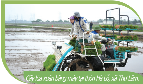
Cây lúa xuân bằng máy tại thôn Hà Lỗ, xã Thư Lâm.

T rong tiến trình tái cơ cấu ngành nông nghiệp theo hướng hiện đại, hiệu quả và bền vững, Hợp tác xã Dịch vụ nông nghiệp và Kinh doanh tổng hợp (viết tắt là HTX) Liên Hà (xã Thư Lâm) đang khẳng định vai trò là một trong những đơn vị đi đầu trong ứng dụng cơ giới hóa vào sản xuất. Không chỉ mạnh dạn đầu tư máy móc, HTX còn chủ động cập nhật các tiến bộ kỹ thuật mới, đưa nhiều giống lúa chất lượng cao vào sản xuất, từng bước nâng cao giá trị sản xuất nông nghiệp trên địa bàn.