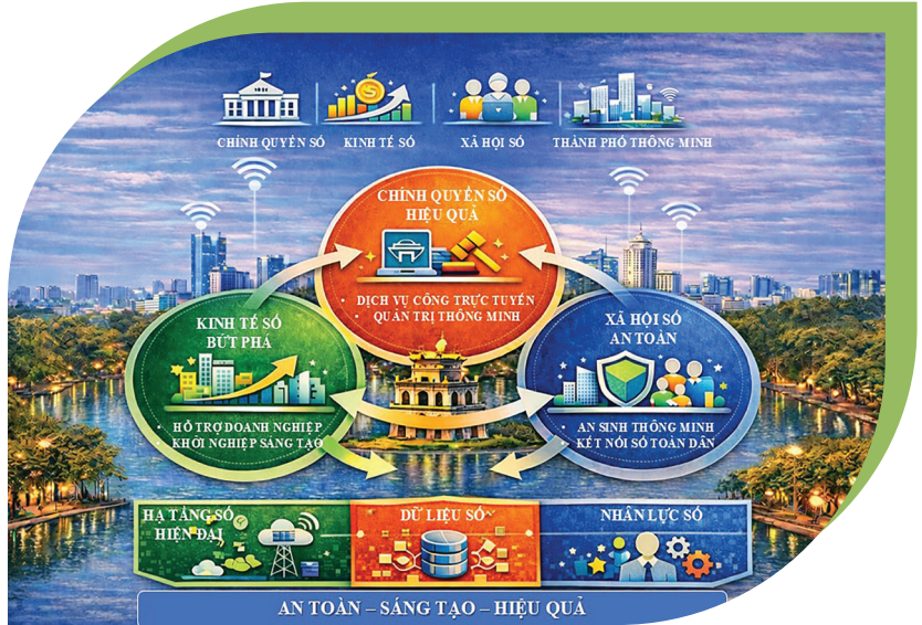
Chiến lược chuyển đổi số thành phố Hà Nội.

Thời gian qua, Thành phố đã đạt nhiều kết