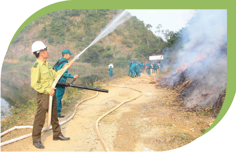
Diễn tập phòng, chống cháy rừng tại xã Mỹ Đức.

H à Nội hiện có gần 27.100 ha rừng và đất lâm nghiệp, phân bố tại 25 xã, phường, tập trung ở các khu vực Ba Vì, Sóc Sơn, Mỹ Đức, Kim Anh, Suối Hai,... Đây là những khu vực có vai trò quan trọng trong bảo vệ môi trường sinh thái và phát triển du lịch. Tuy nhiên, vào dịp đầu năm, nhiều lễ hội diễn ra trong hoặc gần khu vực rừng khiến nguy cơ cháy rừng gia tăng, nhất là khi thời tiết hanh khô kéo dài và lượng du khách đến tham quan, hành lễ tăng đột biến.