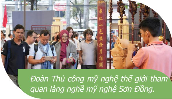
Đoàn Thủ công mỹ nghệ thế giới tham quan làng nghề mỹ nghệ Sơn Đồng.

Làng nghề mỹ nghệ Sơn Đồng, xã Sơn Đồng, thành phố Hà Nội từ lâu đã nổi danh là “thủ phủ” của nghệ thuật tạc tượng và đồ thờ sơn son thếp vàng. Sắp tới đây, khi chính thức trở thành thành viên của Hội đồng Thủ công Thế giới (World Crafts Council - WCC), Sơn Đồng không chỉ gìn giữ hồn cốt nghìn năm mà còn mạnh mẽ khẳng định vị thế trên bản đồ di sản văn hóa toàn cầu.