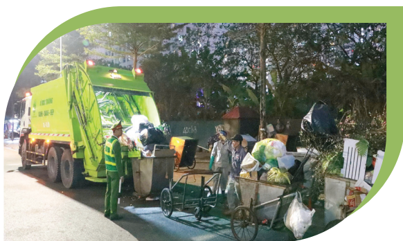
Tổ kiểm tra liên ngành kiểm tra công tác thu gom, vận chuyển rác thải sinh hoạt.

Quy định nêu rõ yêu cầu về bao bì, thùng chứa rác sau phân loại. Đối với hộ gia đình, chất thải thực phẩm phải được chứa trong bao bì màu xanh lá cây; chất thải sinh hoạt khác còn lại sử dụng bao bì màu xám; chất thải nguy hại phải được lưu giữ trong bao bì chuyên dụng, bảo đảm không rò rỉ, phát tán ra môi trường. Tại các khu vực công cộng như công viên, đường phố, nhà ga, bến xe, chung cư, trung tâm thương mại... phải bố trí thùng rác