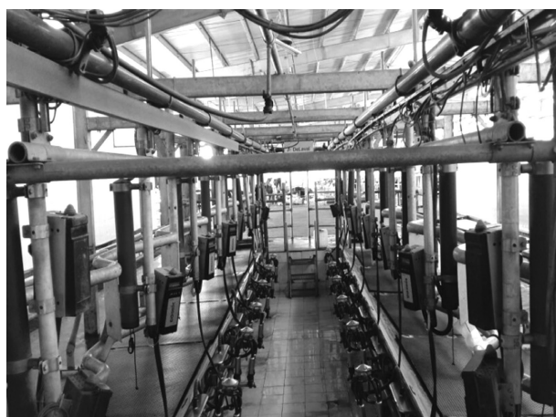
Hệ thống giàn vắt sữa tự động của HTX Đầu tư Nông trại xanh và phát triển bò Ba Vì

Trong thời gian gần đây, tình hình chăn nuôi tại Hà Nội nói chung và chăn nuôi bò thịt, bò sữa nói riêng gặp rất nhiều khó khăn do giá thức ăn, vật tư đầu vào cao, giá sữa tươi, giá bò thịt giảm mạnh, việc tiêu thụ sữa, bò thịt tại một số địa phương còn bấp bênh. Với thực tế trên đã ảnh hưởng không nhỏ đến nhiều hộ chăn nuôi quy mô nhỏ lẻ, tự phát. Tuy nhiên, trong bối cảnh đó vẫn có những trang trại chăn nuôi quy mô lớn ngoài khu dân cư đang phát triển ổn định, bền vững, điển hình là trang trại chăn nuôi bò thịt, bò sữa tổng hợp của hợp tác xã Đầu tư Nông trại xanh và phát triển bò Ba Vì.